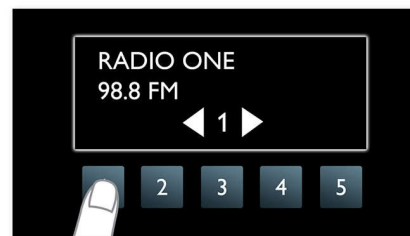
Доступ к любимым радиостанциям одним нажатием кнопки