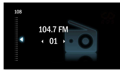
Цифровая настройка для предустановки станций