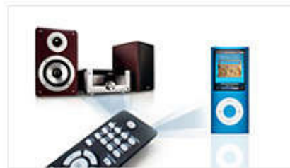
Один пульт ДУ для системы и iPod