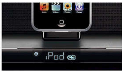
Воспроизведение и зарядка плееров iPod и GoGear

искажений. Технология wOOx обеспечивает исключительно глубокие и динамичные басы, используя весь потенциал АС для ощутимого усиления впечатлений от музыки.