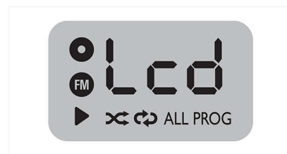
Écran LCD multifonction