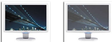
With Dynamic contrast ratio 12000 < contrast ratio 12000

Anda menginginkan layar datar LCD dengan tingkat kontras tertinggi dan gambar paling semarak. Pemrosesan video Philips yang mutakhir dipadukan dengan peredupan ekstrem yang unik dan teknologi pendorong lampu latar menghasilkan gambar yang memukau. SmartContrast akan meningkatkan kontras dengan tingkat kehitaman yang sangat baik dan kinerja akurat dari warna dan bayangan gelap. Memberikan gambar nyata