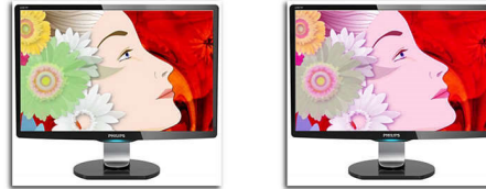
TrueVision On TrueVision Off

TrueVision adalah teknologi algoritme dan pengujian terkemuka milik Philips untuk penyesuaian dan penyetelan monitor, suatu proses ekstensif yang memastikan performa layar terbaik dengan memenuhi suatu standar empat kali lebih ketat dibandingkan persyaratan Vista Microsoft dari masing-masing dan setiap monitor yang meninggalkan pabriknya - bukan hanya beberapa sampel pengujian. Hanya Philips yang bertindak sejauh ini untuk memberikan tingkat akurasi warna yang pas dan kualitas layar di setiap monitor barunya.