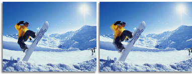
2ms GtG response time > 2ms GtG response time

SmartResponse adalah teknologi pemakaian eksklusif Philips yang ketika diaktifkan, secara otomatis menyesuaikan waktu respons untuk persyaratan aplikasi spesifik seperti permainan dan film yang memerlukan waktu respons yang lebih cepat untuk menghasilkan gambar bebas getaran, kelambatan waktu, dan bayangan gambar