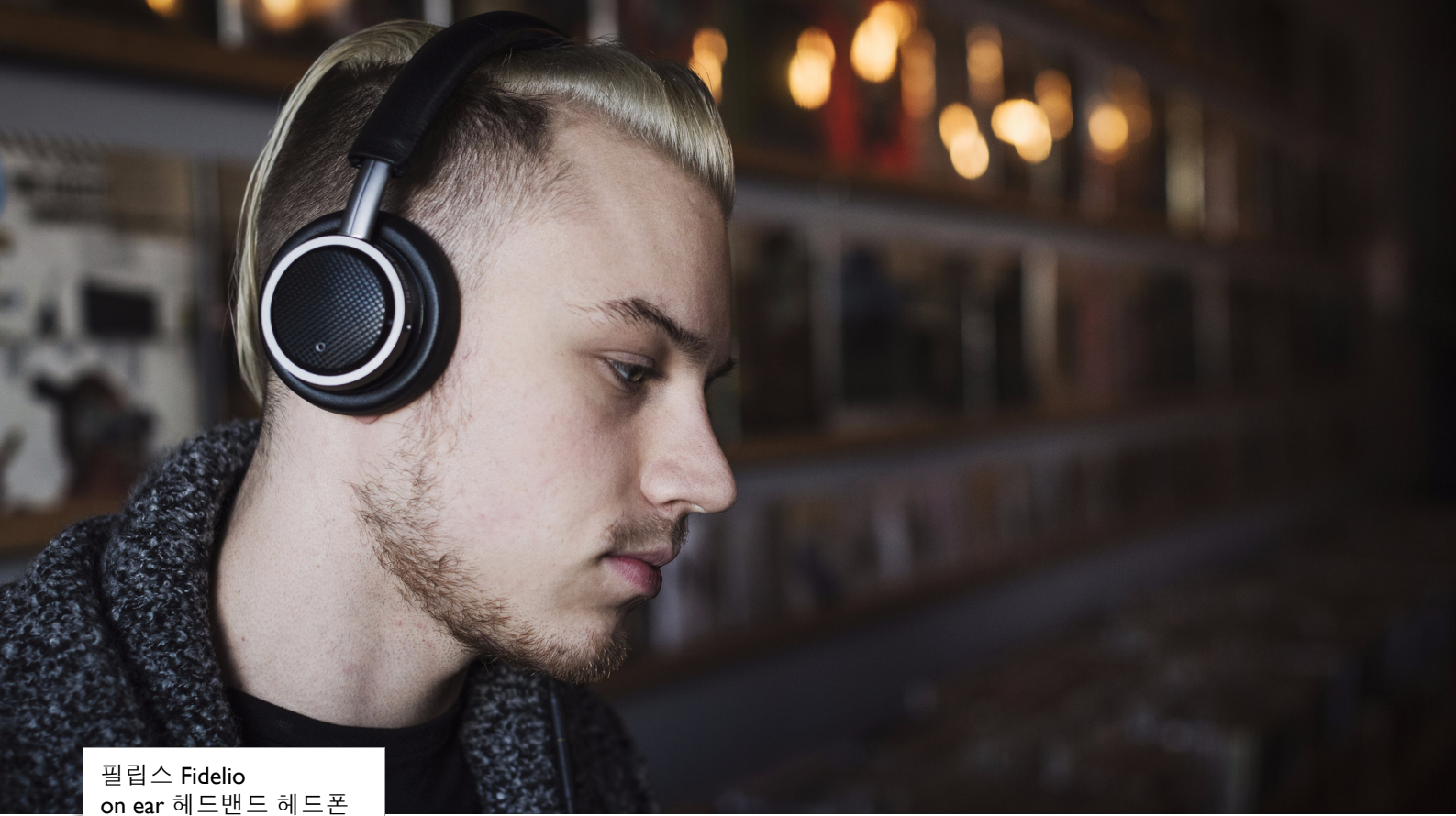
필립스 Fidelio on ear 헤드밴드 헤드폰