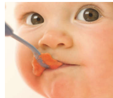
Recipe booklet Nutritious meals made easy BRUNNEN AVENT www.avent.de

Entdecken Sie 12 altersgerechte Rezepte und Tipps zum Füttern, sodass Sie Ihrem Baby einen gesunden Start ins Leben ermöglichen und ihm lebenslang gute Ernährungsgewohnheiten beibringen können.