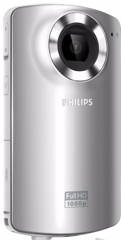
Philips HD videokamera