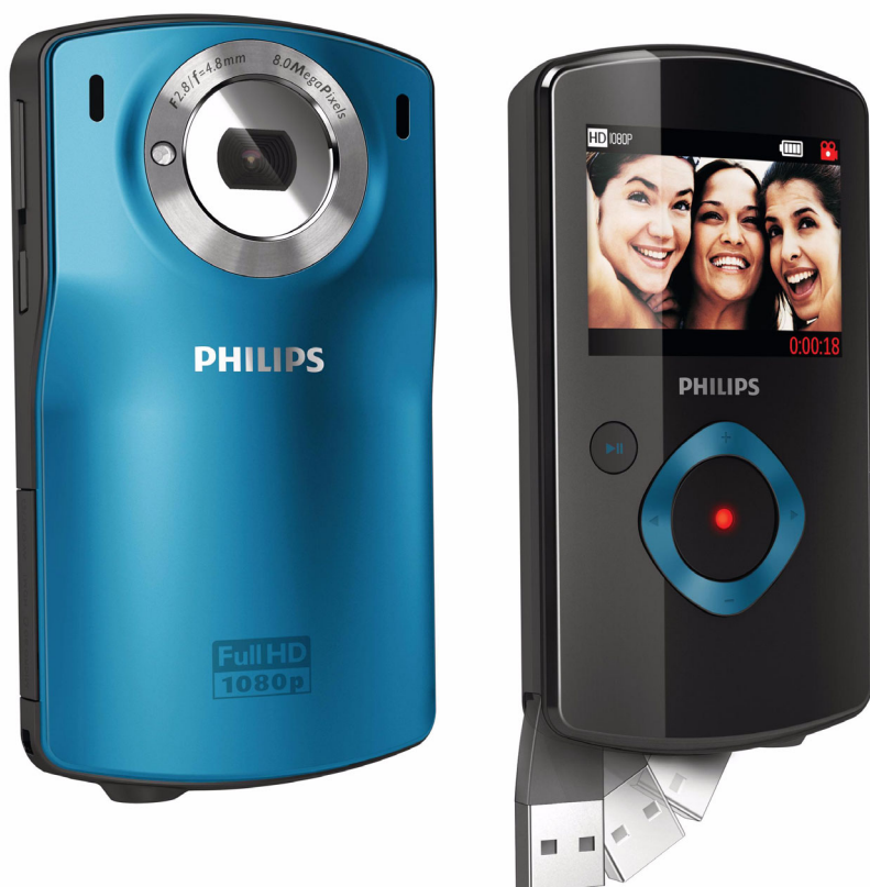
Philips HD videokamera