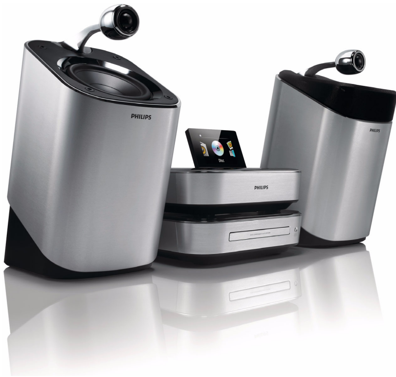
Philips DVD-Komponenten-HiFi- Anlage