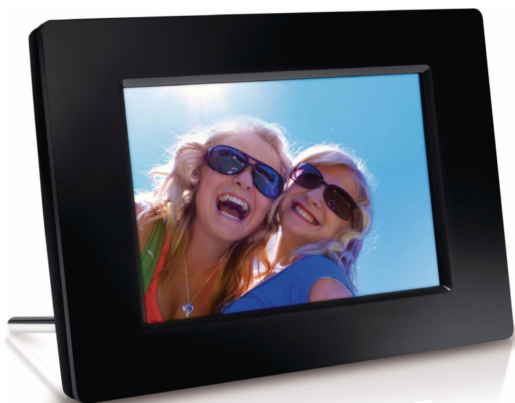
Philips Ramă digitală PhotoFrame