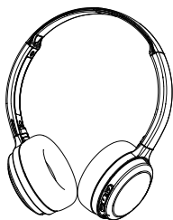
Slúchadlá Philips Bluetooth Philips TAH1108