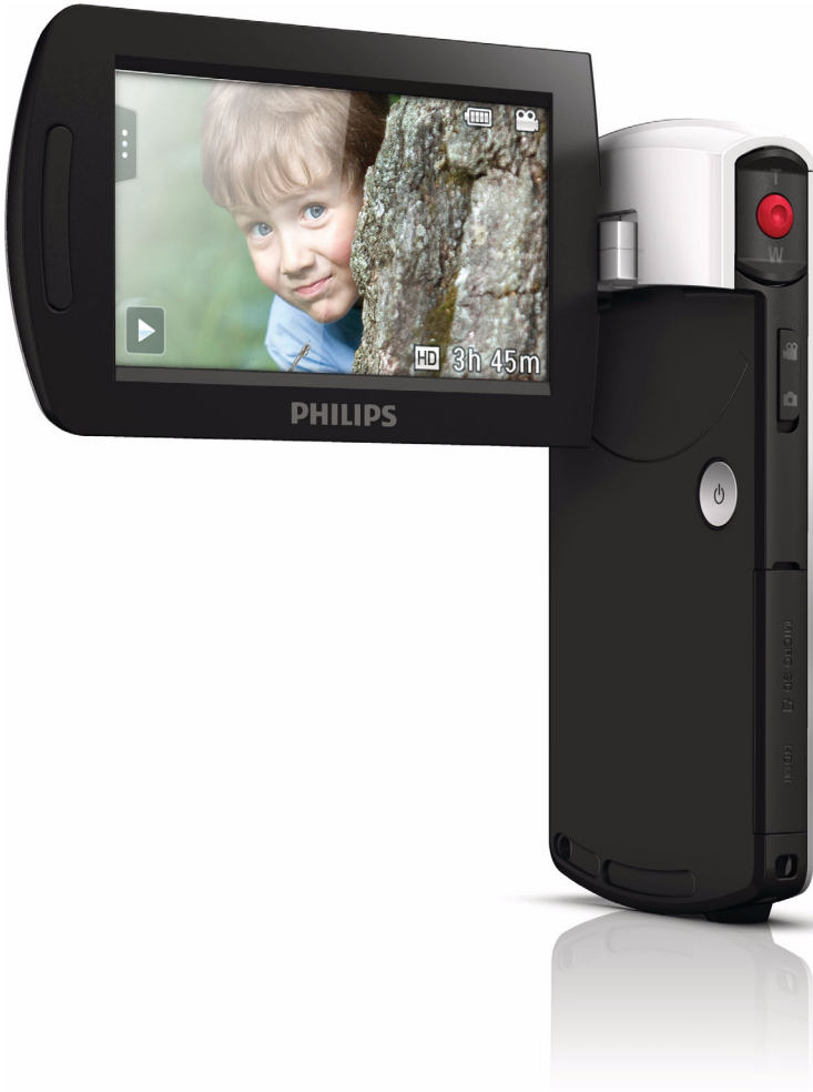
Philips HD video kamera