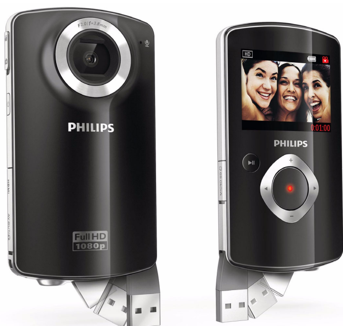
Philips HD videokamera