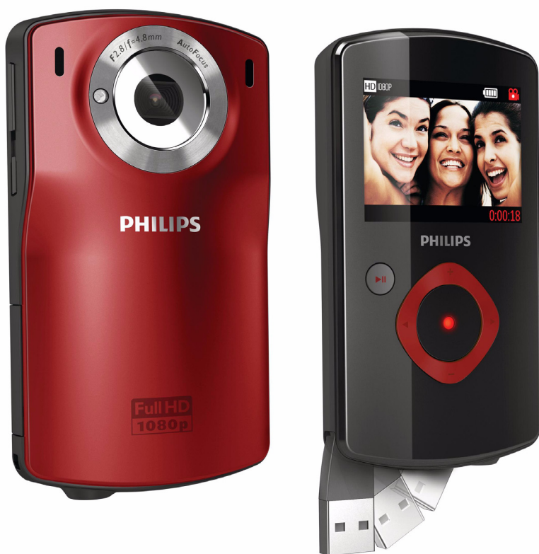
Philips Βιντεοκάμερα HD