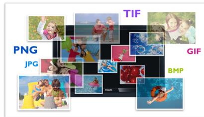
Foto in vari formati

Apri e rivedi le tue foto in un'ampia gamma di formati, inclusi JPEG, JPG, M-JPEG, PNG, TIF, TIFF, GIF, BMP e HD JPEG, direttamente sul tuo TV widescreen. Trasforma il tuo salotto in una galleria di foto e condividi i momenti speciali con amici e familiari.