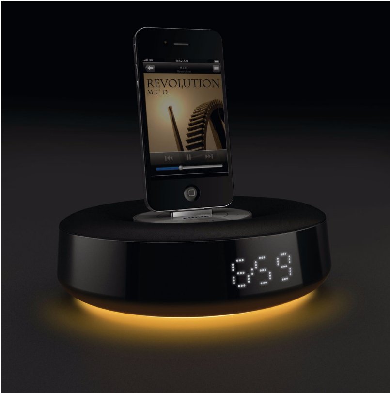
Philips Altavoz con base