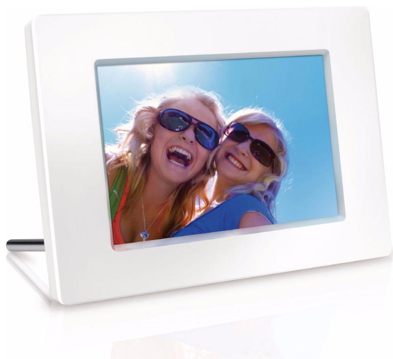
Philips Digitální PhotoFrame