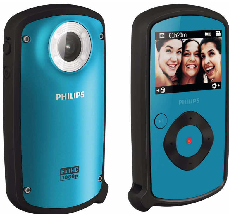
Philips Videocamera HD