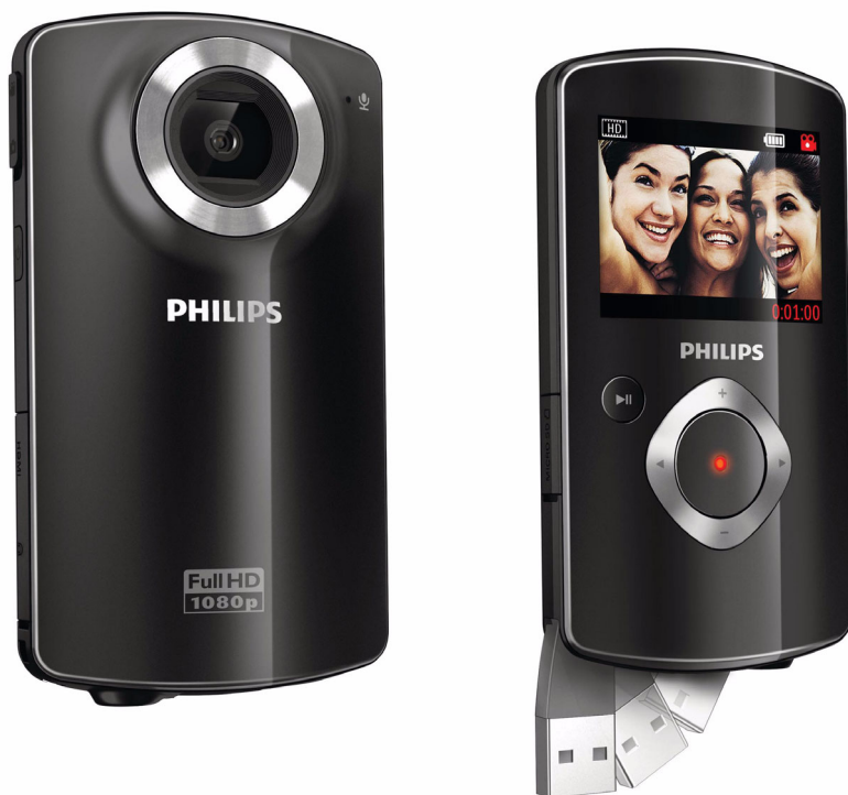
Philips Cameră video HD