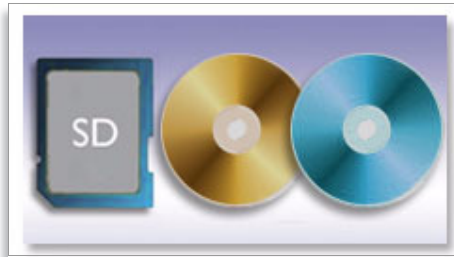
直接从存储卡、DVD 和 CD 查看照片