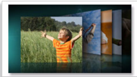
播放幻灯片、单张照片或缩略图