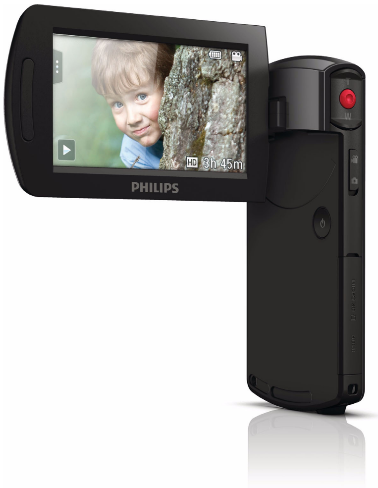
Philips Caméra HD