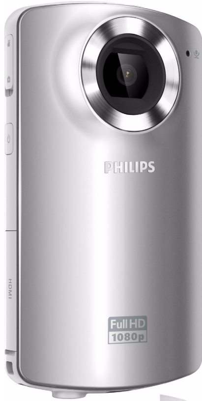
Philips HD video kamera