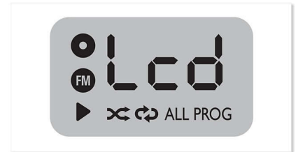
Pantalla LCD multifunción