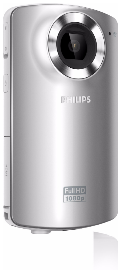
Philips Videocamera HD