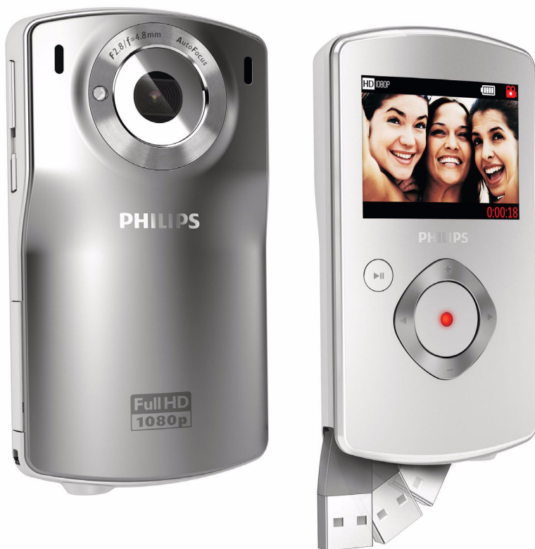
Philips Kamera HD