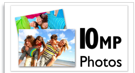
Foto fino a 10 megapixel

Risoluzione massima di 10 megapixel per foto di alta qualità