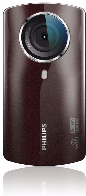
Philips Videocamera HD