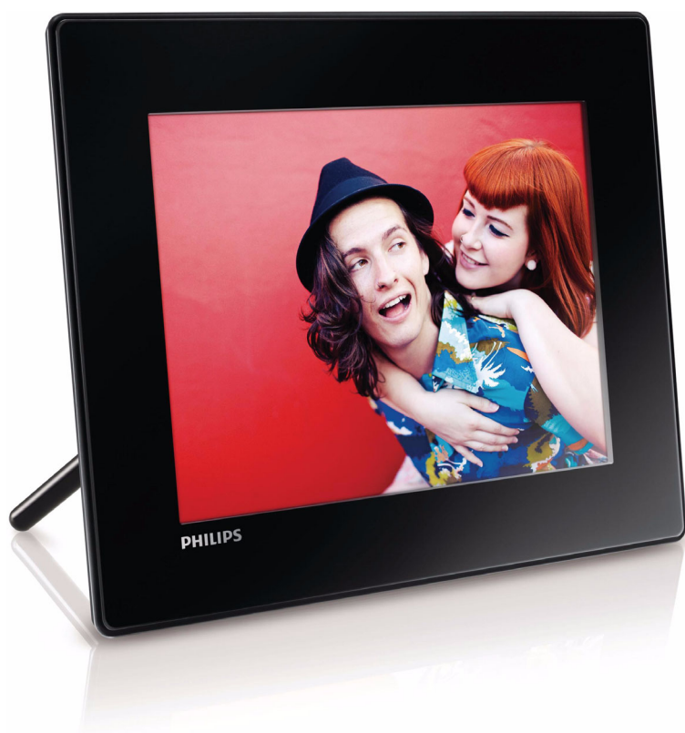
Philips Ramă digitală PhotoFrame