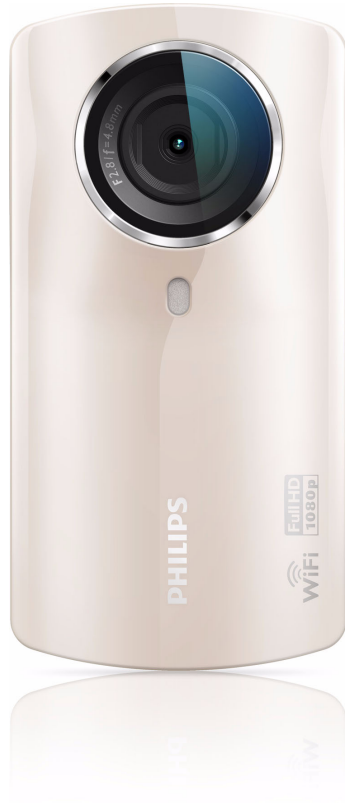
Philips HD video kamera