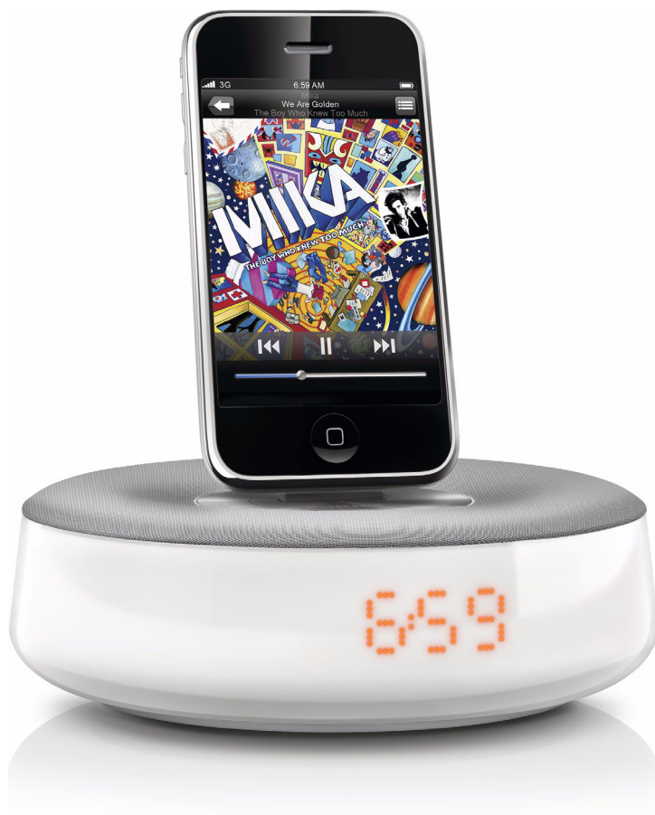
Philips altifalante de base