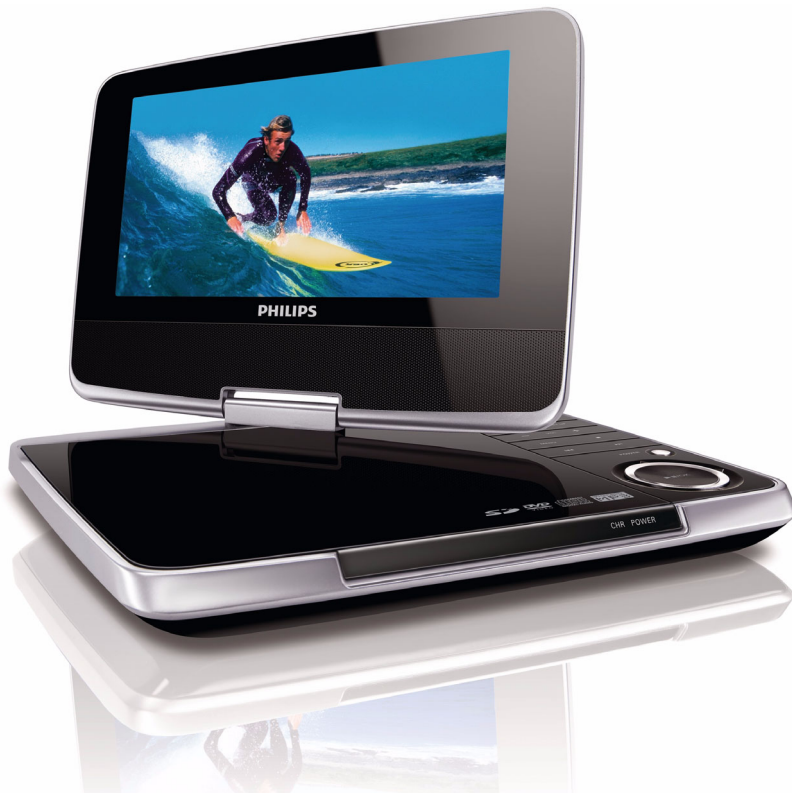
Philips Draagbare DVD-speler