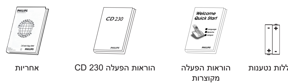
אחריות | הוראות הפעלה CD 230 | הוראות הפעלה מקוצרות | סוללות נטענות

באריזת בעלות אלחוטיים רבים תוכל למצוא אלחוטיים, מטענים ושנאים וסוללות.