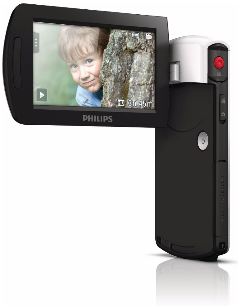
Philips Câmara de filmar HD