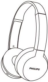
Philips 블루투스 오버 이어 헤드폰 Philips TAH1205