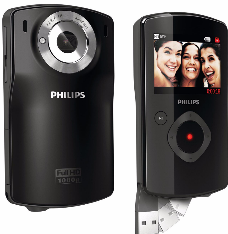
Philips Kamera HD