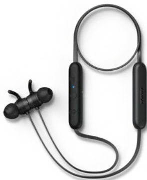
Kufje Philips Bluetooth over-ear Philips TAE1205