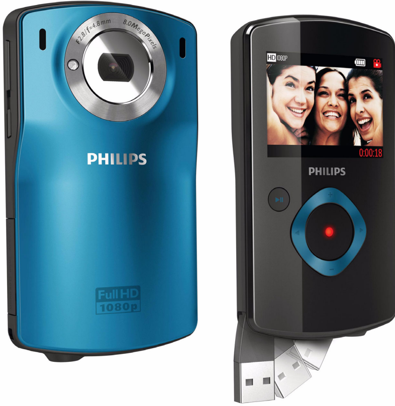
Philips HD video kamera