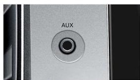
Entrée auxiliaire pour baladeur MP3