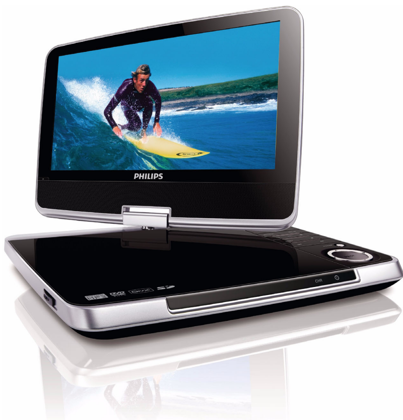
Philips Przenośny odtwarzacz DVD