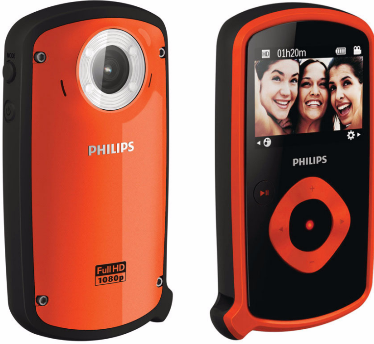
Philips HD video kamera