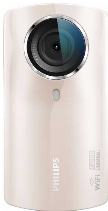
Philips Kamera HD