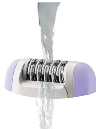
Tête d'épilation lavable