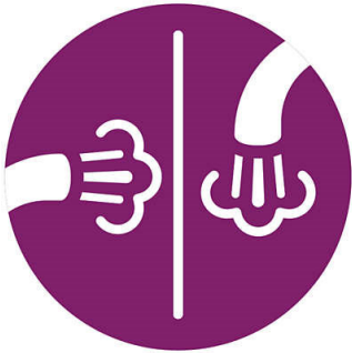
Planche verticalmente para eliminar las arrugas rápidamente y para refrescar prendas colgadas sin una tabla de planchar. Planche horizontalmente para obtener resultados perfectos en áreas difíciles de planchar, como puños y cuellos. En cualquier posición, el vapor continuo potente proporciona excelentes resultados.