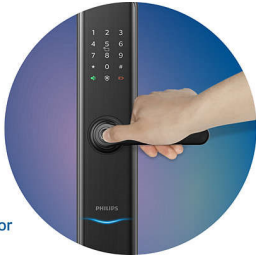
Semiconductor fingerprint sensor

เซ็นเซอร์ลายนิ้วมือผสานรวมอยู่ในค้ำจับแบบคั่นโยกเพื่อให้ปลายนิ้วของคุณวางบนเซ็นเซอร์อย่างเป็นธรรมชาติเมื่อคุณจับค้ำจับ เมื่อการตรวจสอบความถูกต้องเสร็จสมบูรณ์ คุณสามารถกดค้ำจับลงและปลดลลคประตูได้อย่างรวดเร็ว