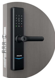
Super B grade lock cylinder

ใส่กุญแจเป็นองค์ประกอบสำคัญที่ควบคุมการเปิดล็อค ใส่กุญแจเกรด C