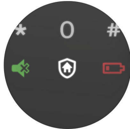
Outside forced lock function

ก่อนออกจากบ้าน คุณสามารถสัมผัสปุ่มบงค้บลลคจากด้านนอกเพื่อเปิดใช้งานฟังก์ชัน ในโหมดนี้ การเปิดประตูจากด้านในจะส่งสัญญาณเตือน คุณสมบัตินี้สามารถเตือนคุณถึงความเสี่ยงด้านความปลอดภัยได้อย่างมีประสิทธิภาพ และอัปเกรดระดับความปลอดภัยภายในบ้าน