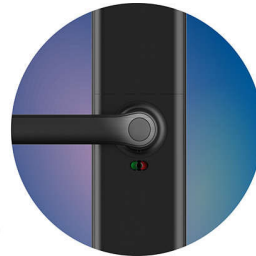
Enable safe handle function

คุณสามารถเปิดใช้งานฟังก์ชันที่จับแบบปลดลลคก่อนออกเดินทาง หลังจากล็อคประตูแล้ว ที่จับที่อยู่ภายในอาคารจะล็อคเพื่อให้แน่ใจว่าไม่มีใครสามารถเปิดประตูได้โดยการผลักที่จับที่อยู่ภายในอาคาร คุณสมบัตินี้สามารถป้องกันการปลดลลคจากภายในผ่านตาแมวประตู ซึ่งช่วยลดความเสี่ยงด้านความปลอดภัยและปรับปรุงประสิทธิภาพการป้องกันการโจรกรรม