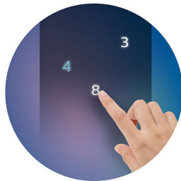
Fake PIN Code

ระบบล็อคอัจฉริยะ Philips มาพร้อมกับเทคโนโลยีรหัส PIN ที่ซ่อนอยู่ ซึ่งช่วยให้คุณซ่อนหมายเลขแบบสุ่มเพื่อระบุด่วนได้สำเร็จ ตรวจจับที่มีการป้อนรหัสผ่านที่แท้จริงอย่างต่อเนื่อง คุณสมบัตินี้สามารถป้องกันการแอบดูและรักษา รหัสผ่านจริงของคุณได้อย่างมีประสิทธิภาพ