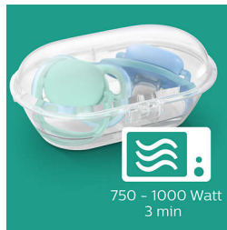
בצעו חיטוי תוך 3 דקות

שלנו, ultra soft 1-ultra air הנרתיק לנסיעות, המגיע עם מוצצי משמש גם כסטריליזטור. כל שעליכם לעשות הוא להוסיף מים ולהכניסו למיקרוגל. כך תוכלו להיות רגועים שהוא נקי לשימוש הבא.