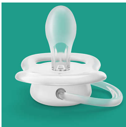
הפטמה עשויה מ-100% סיליקון

ultra soft 1-ultra air אנחנו בוחרים במודע בחומרי סיליקון עבור פטמות שלנו, מאחר שהוא חומר בטוח ונרפה, נמצא בשימוש מרחב ביישומים רפואיים ואינו מכיל כימיקלים מסוכנים, חומרים ואלרגנים (BPA פעילים אנדוקריניים) (למשל