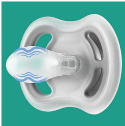
פטמה מוצקה במיוחד

פטמה מוצקה במיוחד מתאימה לצורה הטבעית של החך, השיניים והחניכיים.