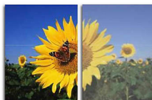
With SmartImage Without SmartImage

SmartImage 是飞利浦独一无二的前沿技术，它通过分析屏幕上显示的内容，带给您优化的显示性能。此用户友好的界面允许您选择“办公软件”、“图像”、“娱乐”、“省电”等多种模式，以适应使用中的应用程序。SmartImage 会根据您的选择动态优化对比度、色彩饱和度以及图像和视频的清晰度，以获得卓越的显示性能。“省电”模式选项主要为您提供节能能力。只需您轻按一下按钮，一切功能立即实现！