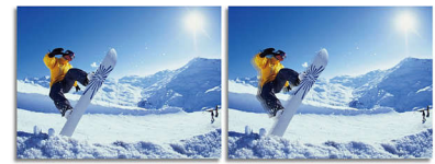
2ms GtG response time > 2ms GtG response time

SmartResponse là công nghệ tăng tốc độ quyền của Philips mà khi được bật lên sẽ tự động điều chỉnh thời gian phản hồi đối với yêu cầu ứng dụng cụ thể, như chơi trò chơi và phim ảnh, những ứng dụng cần thời gian phản hồi nhanh hơn, để tạo hình ảnh không rung, không bị rớt hình và không có bóng mờ