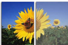
With SmartImage Without SmartImage