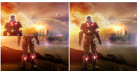
AMD FreeSync™ OFF (simulation) AMD FreeSync™ ON

Žaidžiant nereikia rinktis stringančio žaidimo arba pertraukiamų kadro. Su naujuoju „Philips“