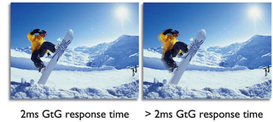
2ms GtG response time > 2ms GtG response time

SmartResponse es una tecnología exclusiva de Philips que ajusta el tiempo de respuesta automáticamente a los requisitos de cada aplicación específica; por ejemplo, los juegos y las películas requieren tiempos de respuesta más rápidos para reproducir imágenes fluidas sin vibraciones, retrasos ni superposición.