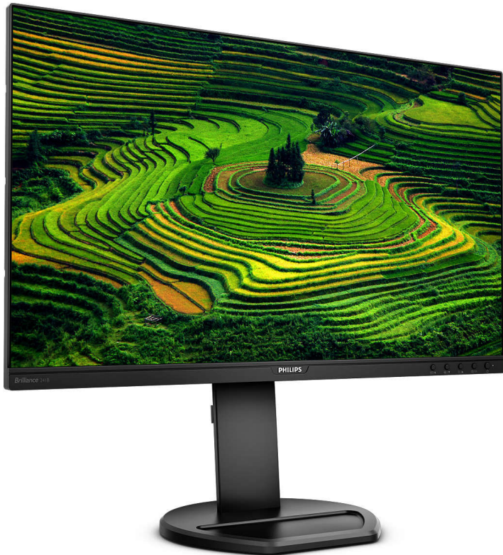
Imagem nítida, desempenho eficiente