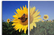
With SmartImage Without SmartImage